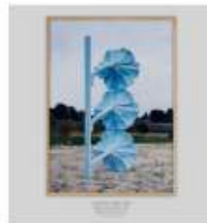
Giuseppe Gabellone Senza Titolo (Fiori), 2002 Stampa fotografica a colori 210 x 150 cm