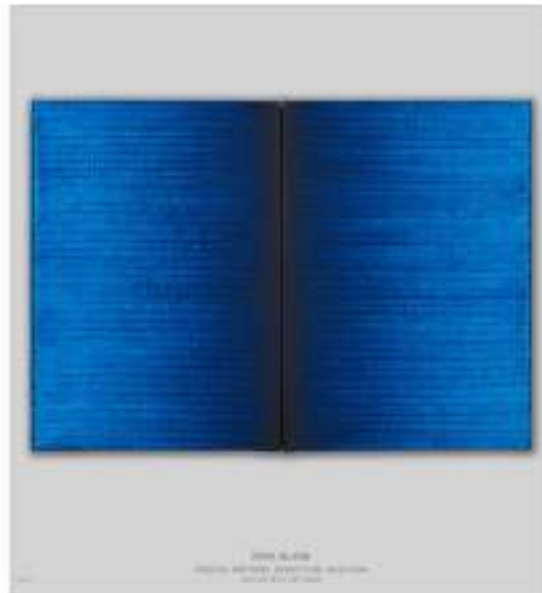
Irma Blank Radical Writings, Exercitium 9-8- 94, 1994 Olio su tela, dittico, 35 x 50 cm, 35 x 25 cm ognuno