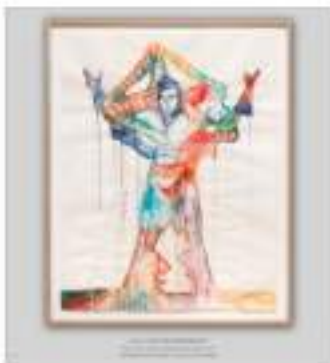
Ulla von Brandenburg Frau auf Mann (Woman on man), 2015 Acquerello su carta 153,5 x 122,5 cm