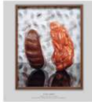
Elad Lassry Bread, 2012 Stampa cromogenica, cornice in legno di noce, 36,8 x 29,2 x 3,8 cm