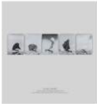
Jochen Lempert Untitled (Blattschneiderameisen), 2016 Stampa alla gelatina d'argento, 36,5 x 29,5 cm ognuno (5 opere)