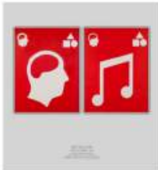
Matt Mullican Untitled (Signs), 1981 Acrilico su carta, 2 fogli, 128,2 x 98,5 x 4,2 cm duo opere