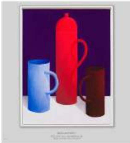
Nicolas Party Still Life, 2014 Pastello su carta, dittico 67,7 x 52,6 x 2,8 cm