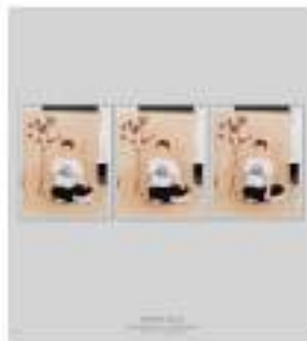
Annette Kelm J'Aime Paris, 2013. (Three parts) Stampa cromogenica, 76,5 x 60,5 cm ognuno, 78,2 x 62,3 cm 3 opere