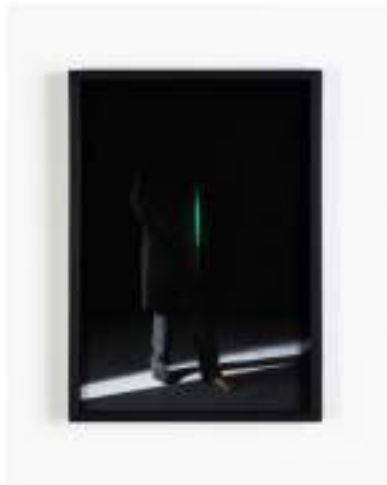
Francesco Gennari Autoritratto come animale, 2018 Stampa a getto d'inchiostro su carta cotone, cornice di legno dipinta dall'artista, 43,5 x 29,5 x 4,2 cm