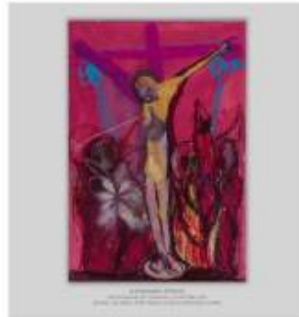
Alessandro Pessoli Crocifissione del carnevale (La vittoria), 2009 Gouache, olio, smalto, spray, pastello a olio su cartoncino, 46 x 31 cm