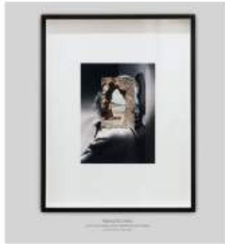
John Stezaker Mask (Film Portrait Collage) CCVI, 2016 Collage 27,3 x 20,1 cm