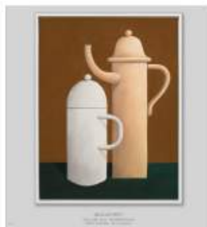
Nicolas Party Still Life, 2014 Pastello su carta, dittico 67,7 x 52,6 x 2,8 cm